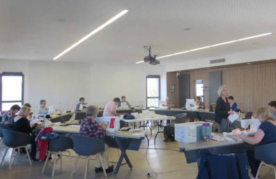
Élus, agents municipaux, bénévoles... se sont succédés plusieurs jours salle du Conseil en Mairie, afin de réaliser 1 000 masques made in* Thouaré, pour la population. *fabriqué à

La prochaine aura lieu le mercredi 20 mai, salle du Conseil en Mairie (accès par l'escalier extérieur). Contact au 06 87 12 57 94 ou p.waudureau@gmail.com.