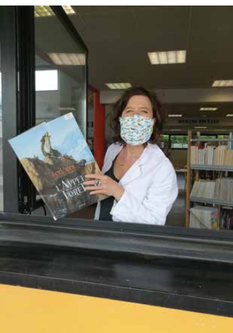
La bibliothécaire, aidée d'agents municipaux, sera parée et équipée, afin d'assurer le drive selon les prérequis sanitaires, dès la semaine du 11 mai.