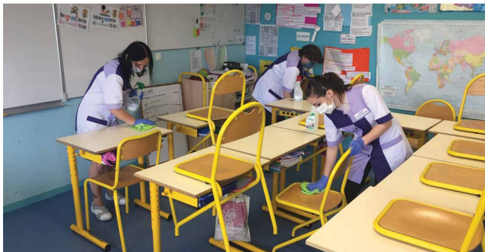
Dès le 5 mai, les agents municipaux de ménage étaient déjà à pied d'œuvre pour le nettoyage des locaux.

Les écoles primaires et le Multi-Accueil rouvrent leurs portes aux enfants thouaréens, la semaine prochaine. Une décision prise par Monsieur le Maire, en concertation avec les directions d'écoles, les services de la ville et les parents d'élèves.