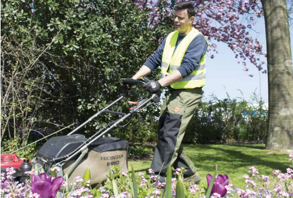
Saison oblige, chaque semaine selon un planning ciblé, un roulement est organisé entre les agents municipaux, afin de maintenir l'entretien des espaces verts communaux (photo prise au printemps 2019).